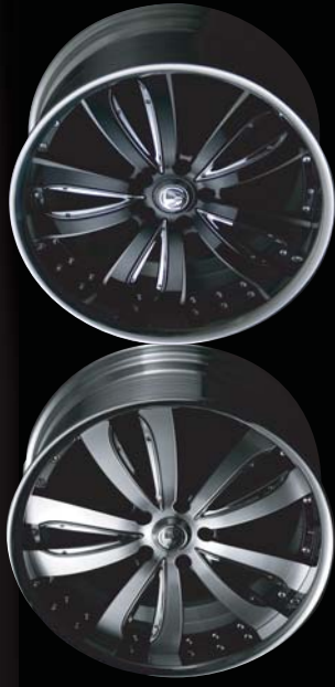
ダイヤモンドカット/サイドブラック

ストラテジーアシリーズに2ピースモデル登場。 ボルトオンによるエクステンションプレート装着。 更にドレスアップの価値を高めるサイドマシニング加工。 新たな領域へ アルティグリオ。